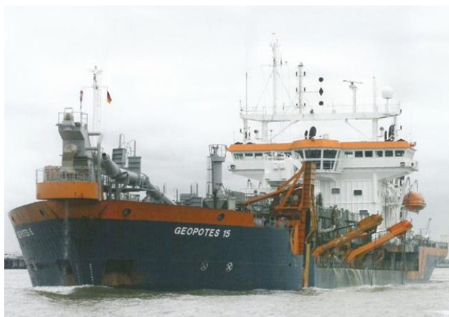
Figura 3.3 – Dragatipo recomendada para efetuar as operações de dragagem/deposição

Na figura seguinte apresenta-se um exemplo do tipo de draga recomendado.