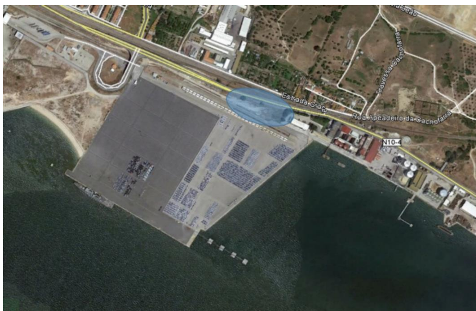
Figura 3.2 - Local previsto para estaleiro de apoio à obra de contenção periférica

Assume-se que a mudança de turnos de dragadores se dará num dos cais acostáveis do Porto de Setúbal, pelo que o estaleiro de apoio a estes trabalhadores, que consistirá essencialmente num contentor, poderá ficar localizado nas atuais instalações do porto. No entanto, a construção do terraplino a montante do terminal Ro-ro necessita de um estaleiro de maiores dimensões. Este estaleiro poderá ficar localizado numa zona anexa ao terminal Ro-ro, num terreno aparentemente sem utilização. Este local permite que o acesso à obra não ocorra através da estrada nacional, o que minimizará os impactos relativos da empreitada.