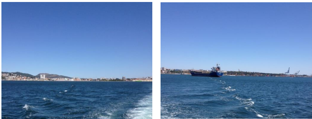
Figura 3.4 - Vista para a zona urbana e industrial de Setúbal