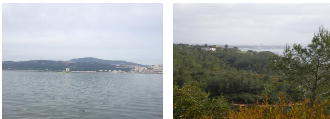
Figura 3.5 - Vistas do Parque Natural da Arrábida